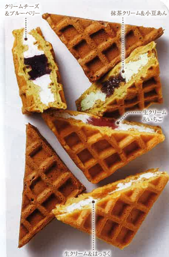
クリームチーズ &ブルーベリー