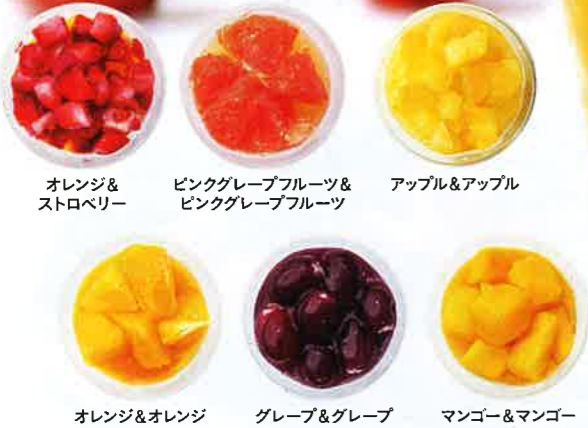
オレンジ&ストロベリー ピンクグレープフルーツ&ピンクグレープフルーツ アップル&アップル オレンジ&オレンジ グレープ&グレープ マンゴー&マンゴー

申込番号 022 【簡易包装】 ホシフルーツ フローズンフルーツジュレ8個 宅配価格 4,440円 【税込】* マンゴー・マンゴー・グレープ&グレープ×各2個、ピンクグレープフルーツ&ピンクグレープフルーツ・オレンジ&オレンジ・オレンジ&ストロベリー・アップル&アップル×各1個 冷凍30日